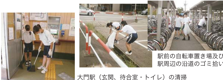
大門駅（玄関、待合室・トイレ）の清掃