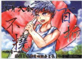
表紙ポスター作成 33H 満田 達也